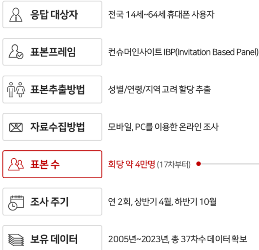
[누적 표본구성 현황] 총 2,239,276명

이 리포트는 컨슈머인사이트가 2005년부터 수행한 '이동통신 기획조사'를 바탕으로 한다. 조사는 컨슈머인사이트의 86만 IBP(Invitation Based Panel)를 표본틀로 연 2회(매년 3~4월/9~10월, 회당 표본 규모 약 4만명-17차부터) 실시하며 이동통신 사용 행태 전반을 조사 범위로 한다. 2023년 상반기에는 3만 4651명을 조사했으며, 표본추출은 인구구성비에 따라 성·연령·지역을 비례 할당하여, 모바일과 PC를 이용한 온라인 조사로 진행됐다.